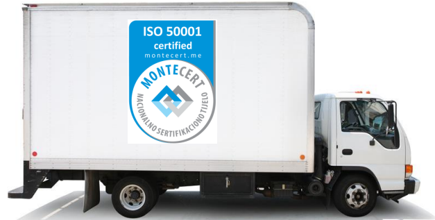
Slika 3. Primer upotrebe znaka sertifikacije na transportnom sredstvu