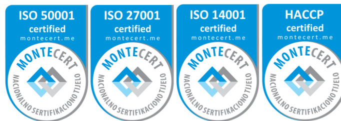
Slika 4. Znakovi sertifikacije za sisteme menadžmenta i HACCP sistem